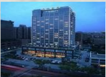
杭州：5☆西湖金座酒店/同級