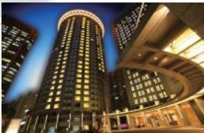
上海：5☆嘉匯華美達酒店/同級