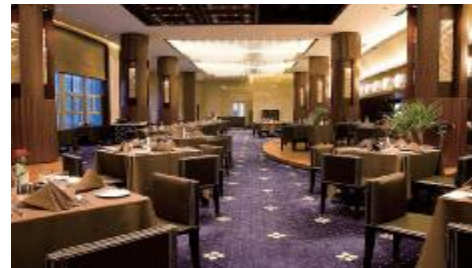
上海：5☆嘉匯華美達酒店咖啡廳