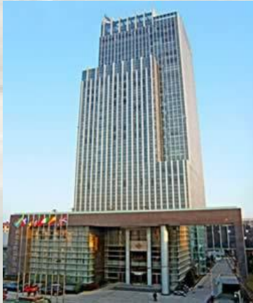
南京：5☆鼎業金陵酒店/同級