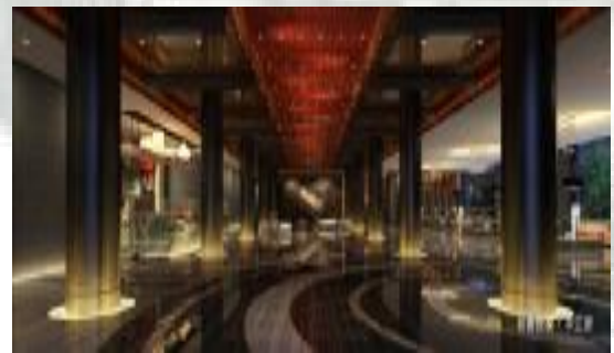
蘇州：5☆書香世家酒店/同級