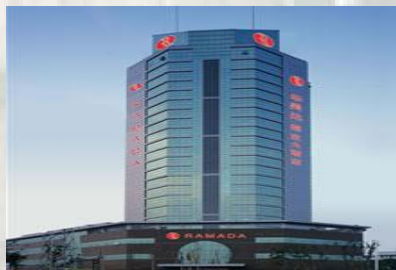
無錫：5☆華美達梨莊酒店/同級